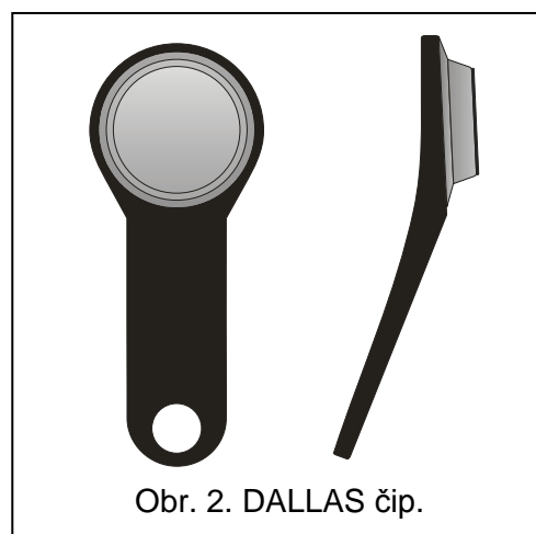
Obr. 2. DALLAS čip.