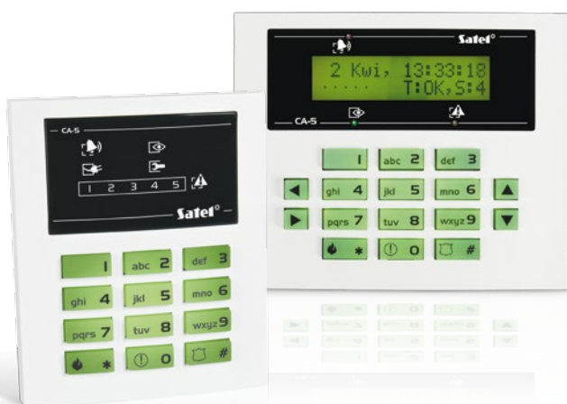
manipulatory CA-5 KLED-S i CA-5 KLCD-S

Codzienna obsługa systemu CA-5 Plus, za pomocą manipulatorów LCD oraz LED, jest wyjątkowo prosta, dzięki czemu bez problemu sprostają jej nawet dzieci lub osoby starsze. Ścisła integracja centrali z modułem komunikacji GSM/GPRS, oferuje dodatkowe i bardzo przydatne funkcje użytkowe. Wśród nich warto podkreślić te najbardziej istotne jak transmisja do stacji monitorującej z wykorzystaniem toru GPRS, zapasowego toru SMS oraz PSTN, czy też powiadamianie użytkownika za pomocą SMS np. o alarmach. CA-5 Plus oferuje użytkownikom możliwość zdalnego sterowania swoim systemem alarmowym w podstawowym zakresie jego funkcjonalności za pomocą wiadomości SMS. To rozwiązanie szczególnie docenią osoby, które często przebywają daleko od chronionego obiektu i nie mają wówczas możliwości lokalnego sterowania systemem.